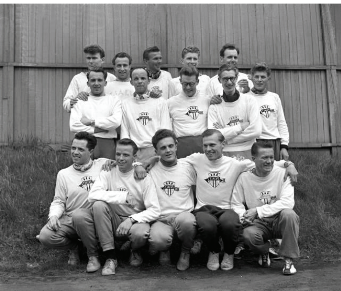
Tjalves lag som vant stafetten i 1953. Til venstre i annen rekke står skilegenden Hallgeir Brenden

Holmenkollstafetten var kommet for å bli. Med økning til 15 etapper og etter hvert også deltagelse fra kvinner og bedriftslag har man på det meste vært oppe i mer enn 2000 lag på startstreken. Etter at joggebølgen til en viss grad forsvant sank også interessen for stafetten,