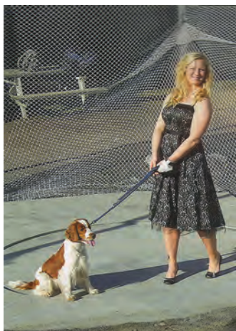
Mona og vov-vov'en