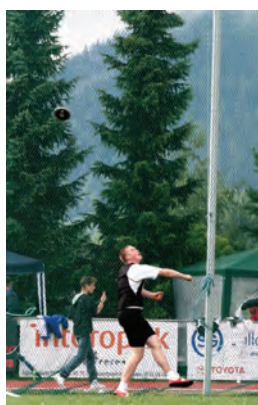
Vegard og diskosen