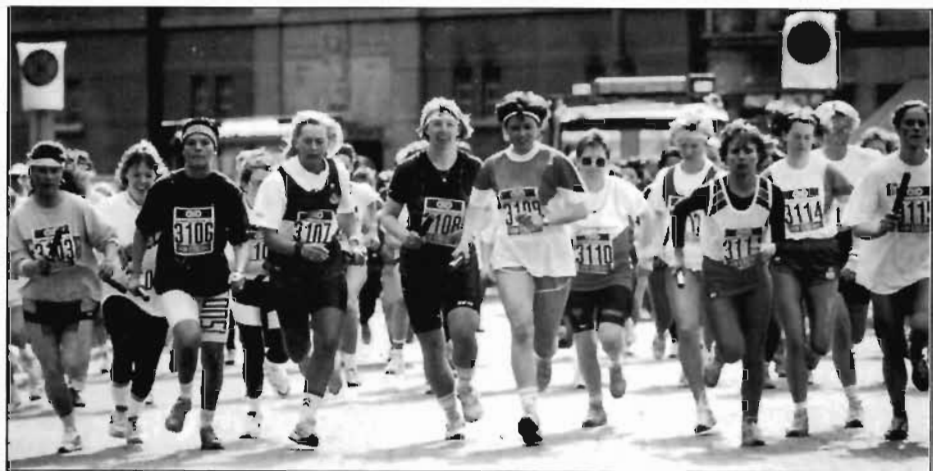
Kvinnene var godt representert i Holmenkollstafetten. Her fra starten på Knud Knudsens plass.

Når det gjelder lagene på seniorsiden er innsatsen ihvertfall for elitelaget på herresiden langt under det man kan forvente. Her