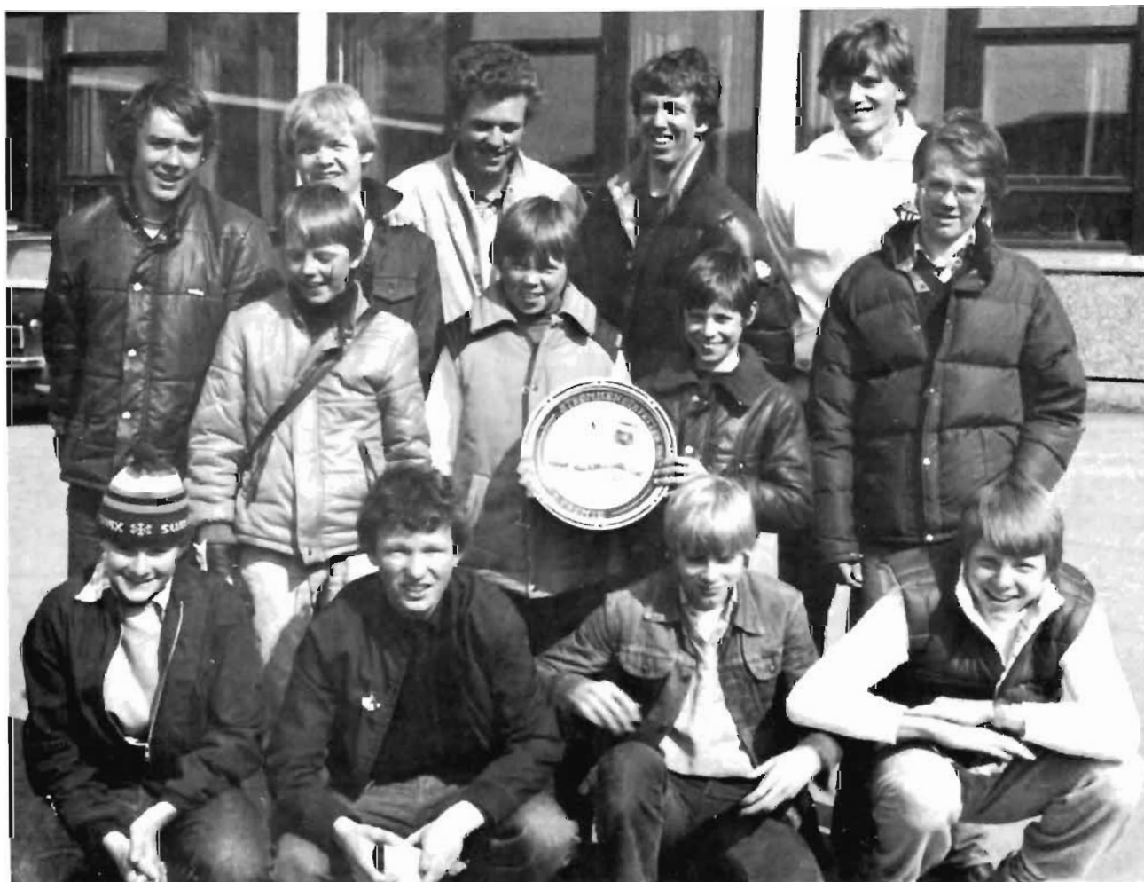
De fleste på Tjalves to guttelag fotografert etter premieutdeling. Her var det Strømmen-stafetten.