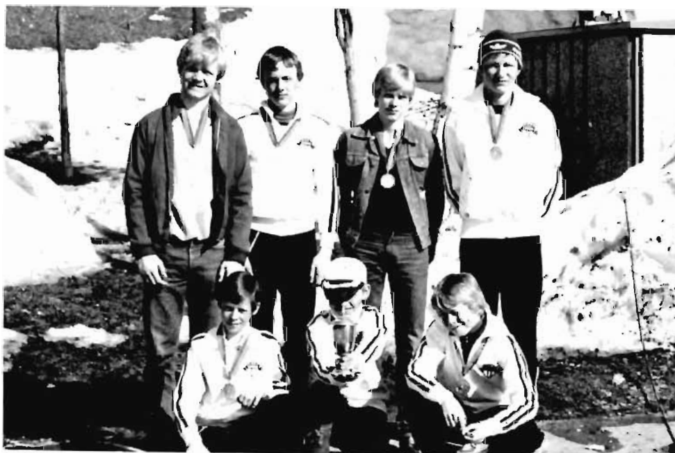
Tjalves guttelag som vant på Bøler