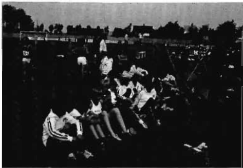
Guttene slapper av