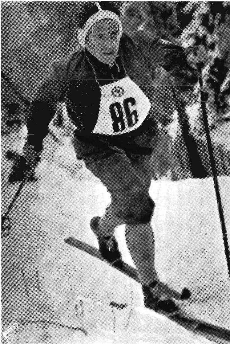
Full fart i Kollens 18 km.